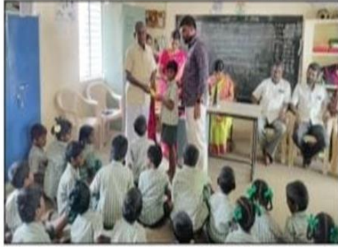
மக்கள் பாதுகாப்பு சேவை அறக்கட்டளையினர் இணைந்து இந்தத் திட்டத்தை அனைத்து பள்ளி மாணவ மாணவிகளுக்கும் கொண்டு செல்லும் நோக்கத்தில் எண்ணும் எழுத்தும் திட்டமாகும் நடைபெற்றது.

உள்ள மாணவ மாணவியருக்கு கற்றல் நிறை குறைத்து காணப்பட்டதால் மீண்டும் கற்றல் நிறை மேம்படுத்த தமிழக அரசால் எண்ணும் எழுத்தும் திட்டம் கொண்டுவரப்பட்டது. இத்திட்டத்தில் மாணவ மாணவியருக்கு ஆடல், பாடலுடன் கற்றல் நிறை மேம்படுத்து வதற்காக தமிழக அரசால் கொண்டு வரக்கூற இந்திட்டுத்தினை ஸ்ரீ ஜிவிஜி விசாலாட்சி மகளிர் கல்லூரி ஆங்கிலத்துறை விரிவாக்கத் திட்டம் கீழ் ஆங்கிலத்துறை 3-ம் ஆண்டு மாணவிகள் மற்றும் டாக்டர் அப்துல் கலாம்