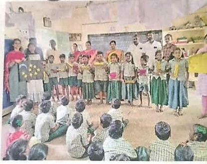
எண்ணும் எழுத்தும் திட்டத்தில் வெற்றி பெற்ற மாணவ, மாணவிகளுக்கு பரிசுகள் வழங்கப்பட்டன.

ஸ்ரீ ஜிவிஜி விசாலாட்சி மகளிர் கல்லூரி ஆங்கிலத் துறை விரிவாக்கத் திட்டத்தின் கீழ் ஆங்கிலத் துறை மூன்றாம் ஆண்டு மாணவிகள் மற்றும் டாக்டர் அப்துல் கலாம் மக்கள் பாதுகாப்பு சேவை அறக் கட்டட னையினர் இணைந்து இந்தத் திட்டத்தை அனைத்து பள்ளி மாணவ மாணவிகளுக்கும் கொண்டு செல்லும் நோக்கத்தில் நடத்தினர். தற்போது முதல் பருவத்தேர்வு முடிந்த நிலையில் இரண்டாம் பருவ தேர்வுக்கு மாணவ-மாணவிகளை தயார் செய்யும் நோக்கத்தில் எண்ணும் எழுத்தும் திட்டத்தில் கையேட்